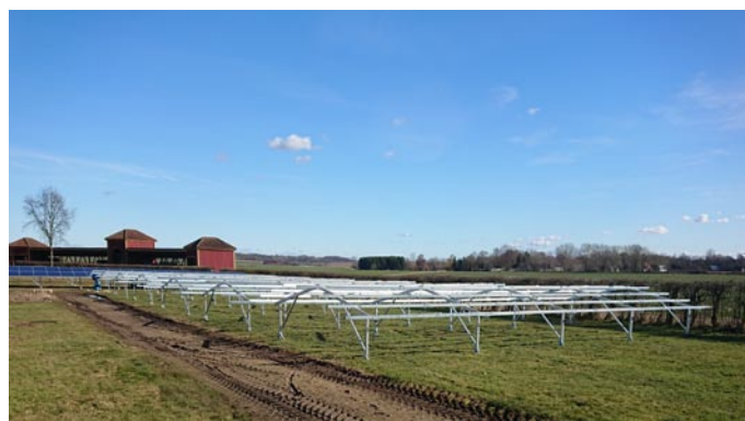
Implementa Sol ABs pågående installation av 147 kWp-anläggning i Svalövs kommun.